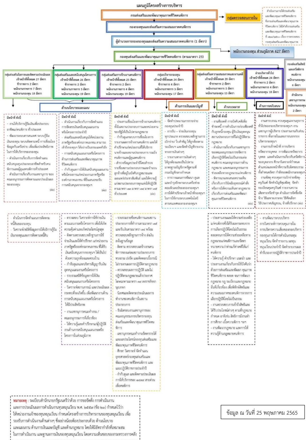
ภาพที่ 1.2 แสดงแผนภูมิโครงสร้างกองกองทุนและส่งเสริมความเสมอภาคคนพิการ